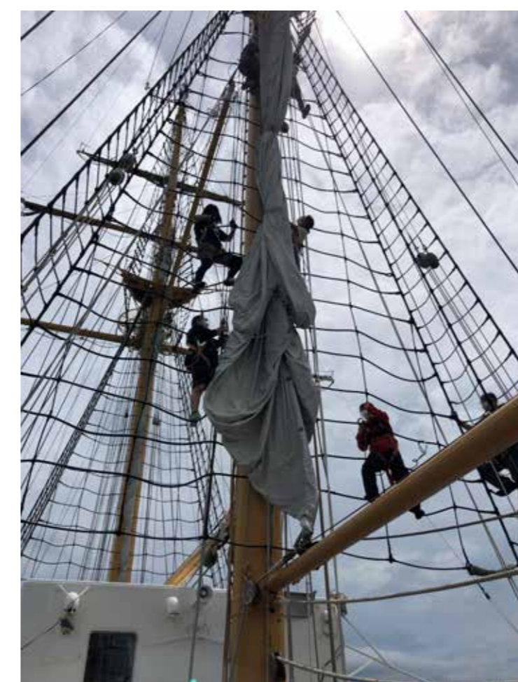
タイザガスケット