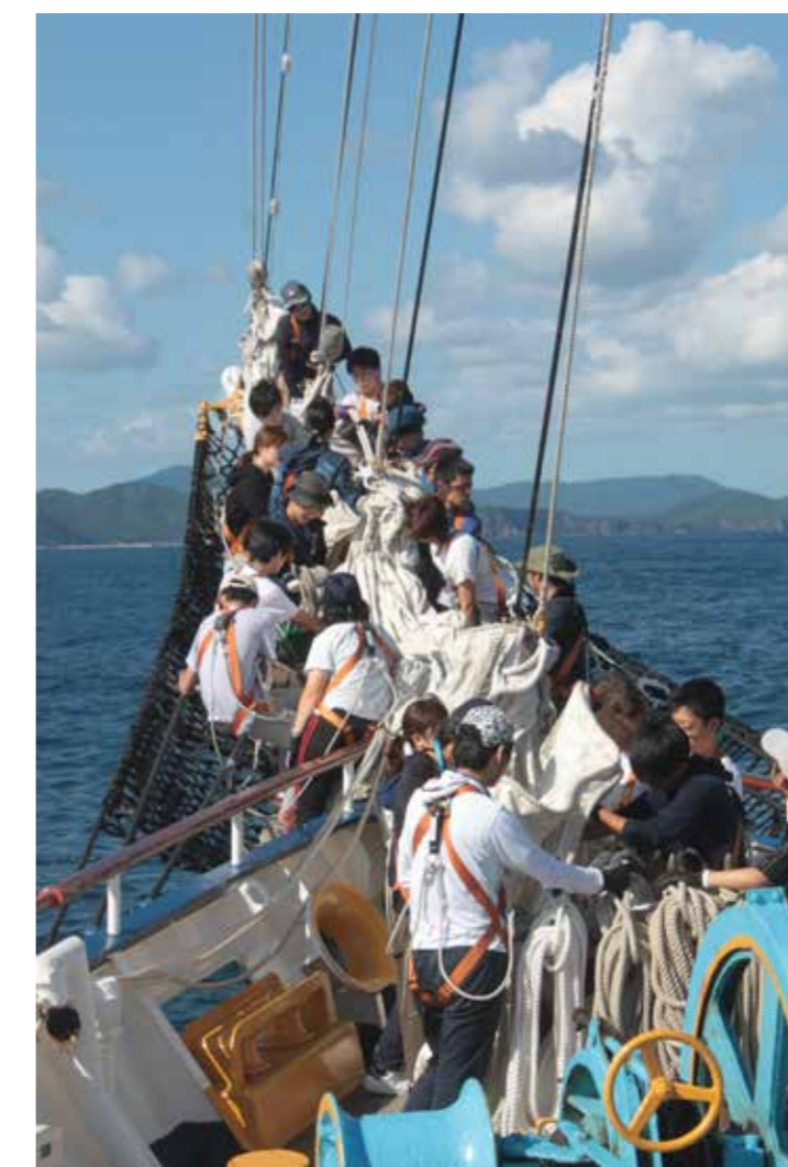
ルーズガスケット